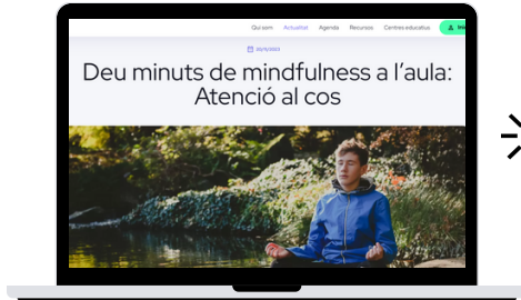
Deu minuts de mindfulness a l'aula: Atenció al cos