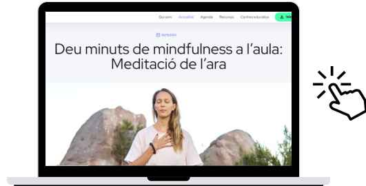
Deu minuts de mindfulness a l'aula: Meditació de l'ara